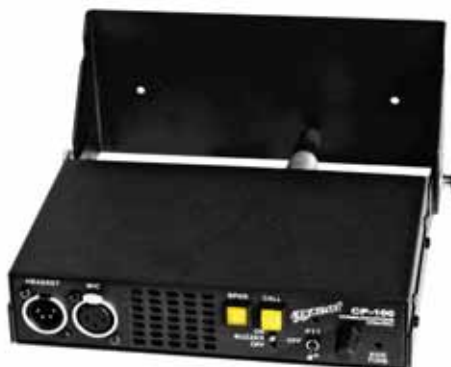
CP-100 mit Wandhalterung