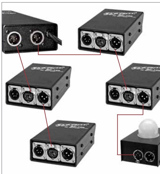
Schematische Darstellung eines typischen Systembetriebes

Da der Einsatz von Digitalmischpulten oft keine Side-Racks mehr notwendig macht, ist diese Stromversorgung eine kompakte Möglichkeit des Betriebs einer Intercomanlage. Bis zu 6 Intercom-Beltpacks können mit einer PS-100 betrieben werden. Die Stromversorgung besitzt zwei Partyline-Intercom-Ausgänge mit XLR-M-Steckverbindungen, eine auswechselbare Sicherung und einen Spannungswahlschalter 120 V/240 ~V.